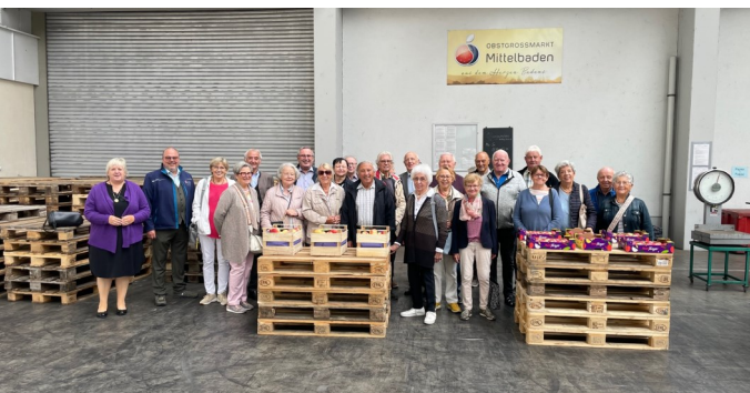
Die Senioren Union im Kreis stellt sich derzeit neu auf: Neulich besuchte sie den Obstgroßmarkt „OGM“ in Oberkirch.

In diesem Jahr fand bislang ein Besuch im Europäischen Parlament in Straßburg mit Diskussion mit dem Vizepräsidenten des Parlaments und Landesvorsitzenden der Senioren Union Baden-Württemberg, Rainer Wieland MdEP statt.