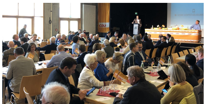
Der diesjährige Kreisparteitag fand in Oberkirch statt.

Jüngst fand im Forum des Oberkircher Hans-Furler-Gymnasiums, man könnte sich keinen trefflicheren Ort für eine Versammlung der Kreis-CDU vorstellen, der Kreisparteitag der CDU Ortenau mit Delegiertenwahlen für den Bezirks-, Landes- und Bundesparteitag statt.